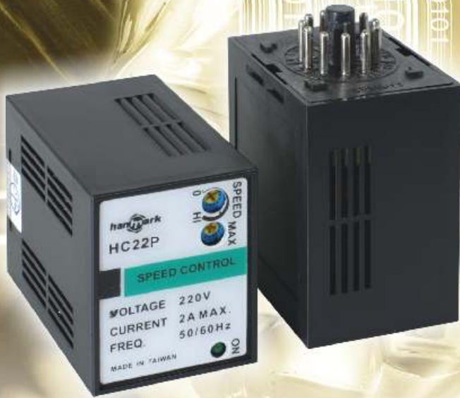
HC21P/HC21-SSD 單相 110V用 HC22P/HC22-SSD 單相 220V用